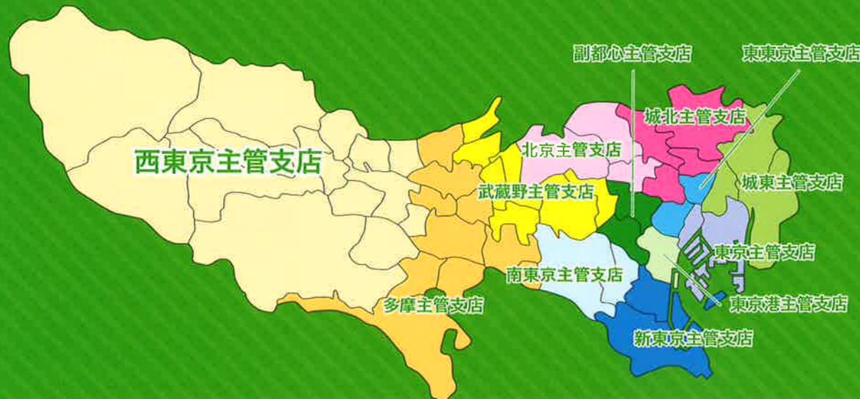
西東京主管支店が含まれる東京支社の集配担当エリアマップ

ヤマト運輸の中で稼ぎ頭と言える東京支社の12エリアの中で最も広域なエリアをカバーする西東京主管支店では、入社後、自宅から通える範囲にある育成環境の整った支店・センターに配属されます。